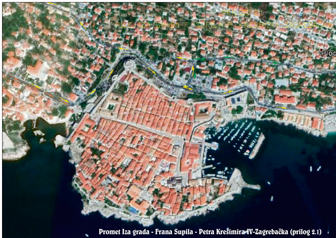
Promet Iza grada - Frana Supila - Petra Krešimira IV-Zagrebačka (prilog 2.1)