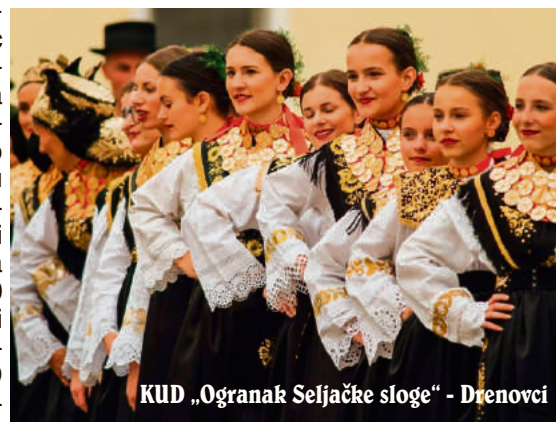
KUD „Ogranak Seljačke sloge“ - Drenovci

Sudionici Smotre folklor Na Neretvu misečina pala u Metkoviću , već tradicionalno u organizaciji Turističke zajednice grada Dubrovnika svoje plesne točke, nakon Metkovića, izvode i na Stradunu. Tako će i ovaj vikend, 19. i 20. svibnja, u 10:30 ispred crkve sv. Vlaha nastupiti pet folklornih skupina, četiri iz različitih krajeva Hrvatske i jedna iz Slovenije. U subotu će u 10:30 ispred crkve sv. Vlaha nastupiti predstavnici smotre izvornog folklor Karlovačke županije KUD „Klek“- Ogulin, Veteranska folklorna skupina KUD „Beltinci“ - Beltinci (Slovenija) te predstavnici smotre folklor „Đakovački Vezovi“ - KUD „Lipa“- Semeljci. U nedjelju u 10:30 također ispred crkve sv. Vlaha nastupit će predstavnici smotre folklor „Brodsko kolo“- KUD „Kupina“- Kupina i predstavnici smotre folklor „Vinkovačke jeseni“ - KUD „Ogranak Seljačke sloge“ - Drenovci.