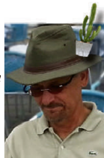
Piše: Mario Klečak

Uz par stranica opore kritike gradonačelniku, kažu neki, njihov odlazak bi bio, civilizirano rješenje problema. Na jugu, naših talijskih susjeda , za ovakve gafove, gradonačelniku bi u postelju mogla uskočiti' - konjska glava.