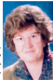
Piše: Marija Đanović

Ah, Bože, išteti mi vas poso ova Pera. Dođoh u Grad imat kigodi pjačer, a ja viđu neću imat neg` samo despjačer. Što mogu ja sada?