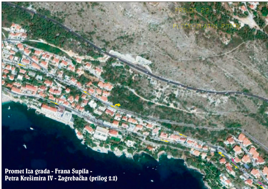
Promet Iza grada - Frana Supila - Petra Krešimira IV - Zagrebačka (prilog 2.2)

vatljivoj udaljenosti cca 100-200m od ulaza u Grad.