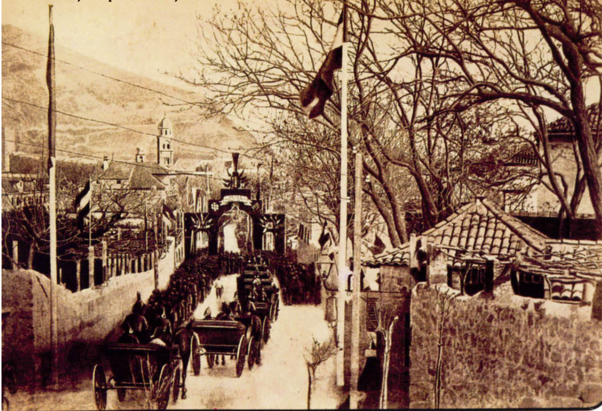
Dolazak Franja Josipa I. 27. travnja 1875. u Dubrovnik

Moj komentar je: neka mi sad netko reče kako su naši stari bili dobri, uljudni i pošteni. Kako nekad tako i sada. Ili obrnuto: kako sada tako i nekad.