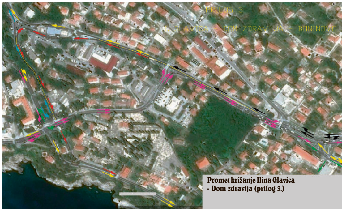
Promet križanje Ilina Glavica - Dom zdravlja (prilog 3.)

Svi prometni tokovi prikazani na ovom rješenju se mogu u naravi i realizirati uz relativno male izdatke na i pri izmjeni postojećih elemenata horizontalne, vertikalne i svjetlosne signalizacije gradskih prometnica, međutim to i nije neki problem, već je to „volja“ da se iznađe i prihvati odgovarajuće tehničko rješenje, te je time proteklo vrijeme za naše dugogodišnje „promišljanje“ i iznalaženje cjelovitog prometnog rješenja Grada Dubrovnika naš najveći izdatak. Denis Pavela