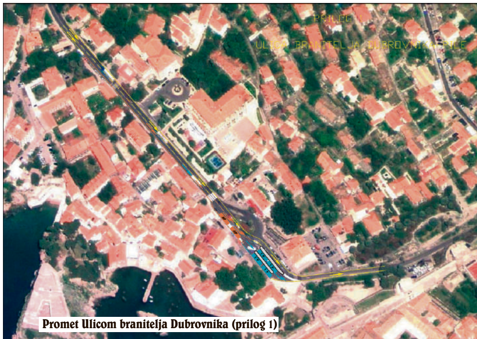
Promet Ulicom branitelja Dubrovnika (prilog 1)

- ukoliko se vozite sjevernom prometnom trakom i želite u hotel Hilton Imperial, isključite se nesmetano lijevo, a poslije se uključite lijevo u smjeru Pila